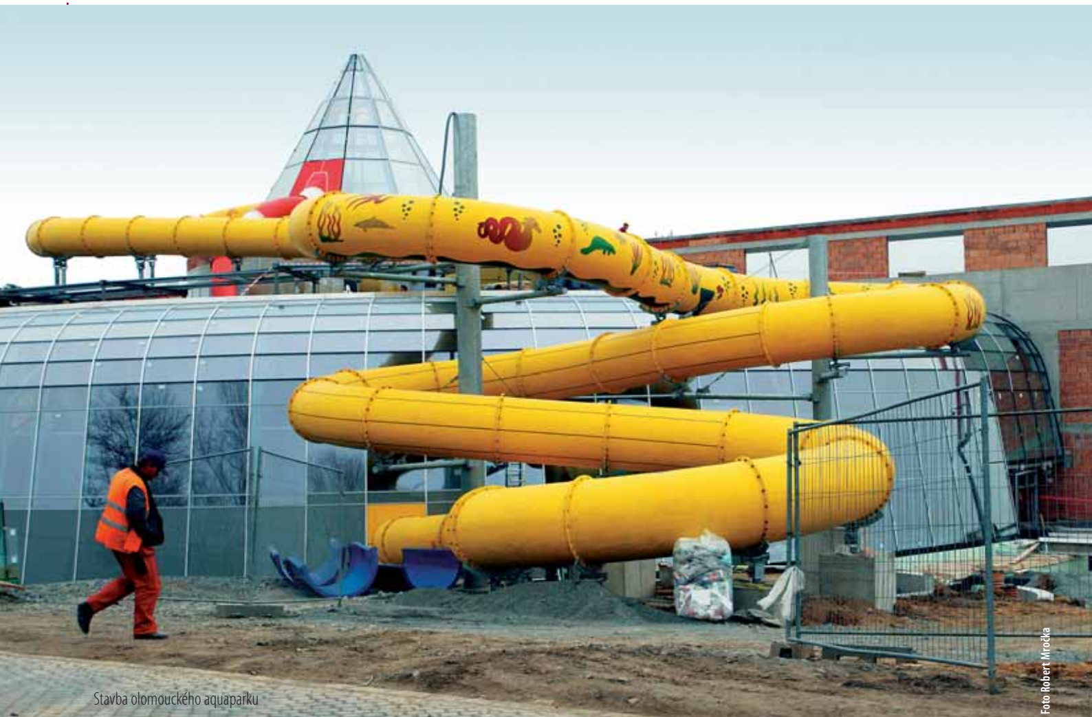
Stavba olomouckého aquaparku

Z toho důvodu musí být město připraveno na nejrůznější příležitosti. „Rozevíráme vějíř možných investic na území města a samozřejmě se budeme primárně věnovat těm, na které získáme peníze. Šťěstí přeje připraveným a my chceme být připraveni, aby peníze z Evropy